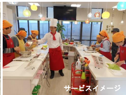
サービスイメージ